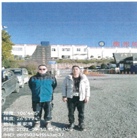
项目门头（采样人员）