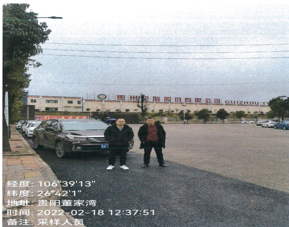
项目门头 (采样人员)